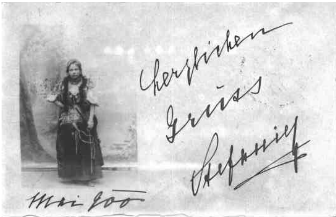
100 Jahre alte Ansichtskarte mit Originalunterschrift Kronprinzessin-Witwe Stefanie