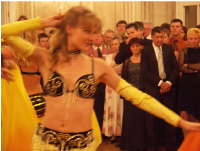
Eine der zahlreichen Showeinlagen