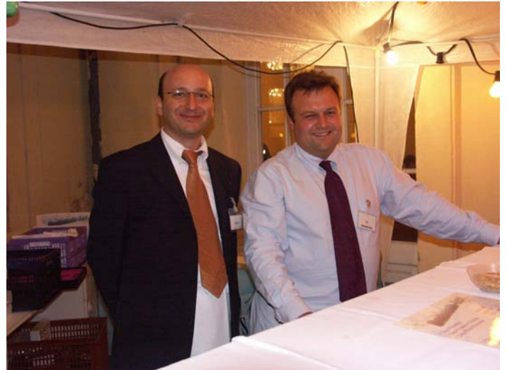
Mondscheinbar im Freien