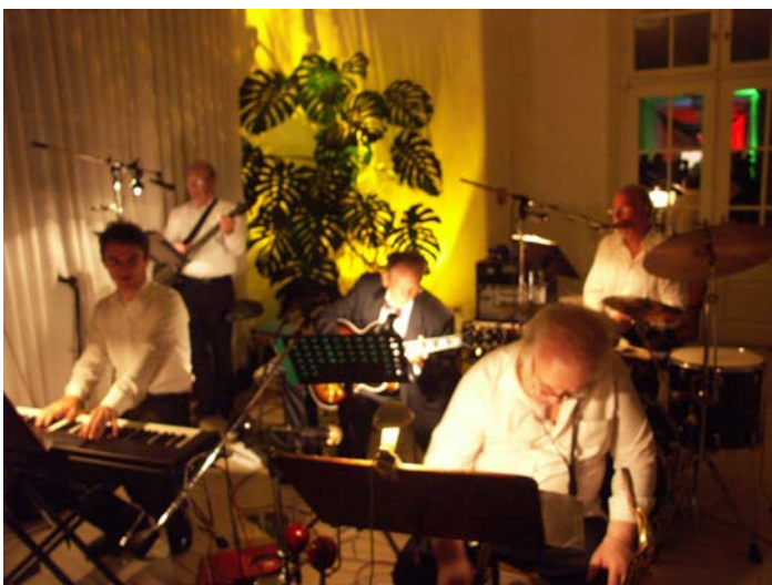
The Sorrentos auf der 2. Tanzfläche an der Bar