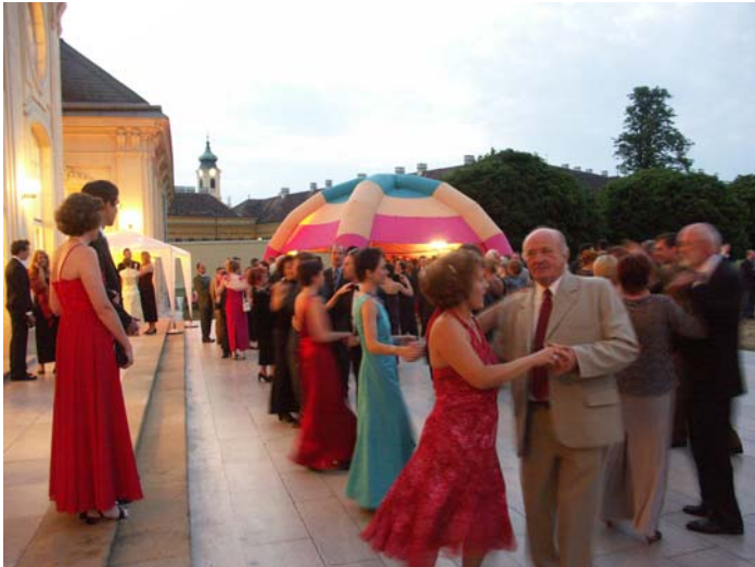
Tanzterrasse mit Eventzelt und Mondscheinbar