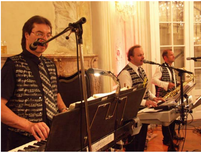
Franky & Co. im Festsaal