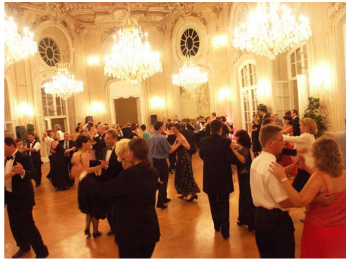
Tanzfläche im Festsaal