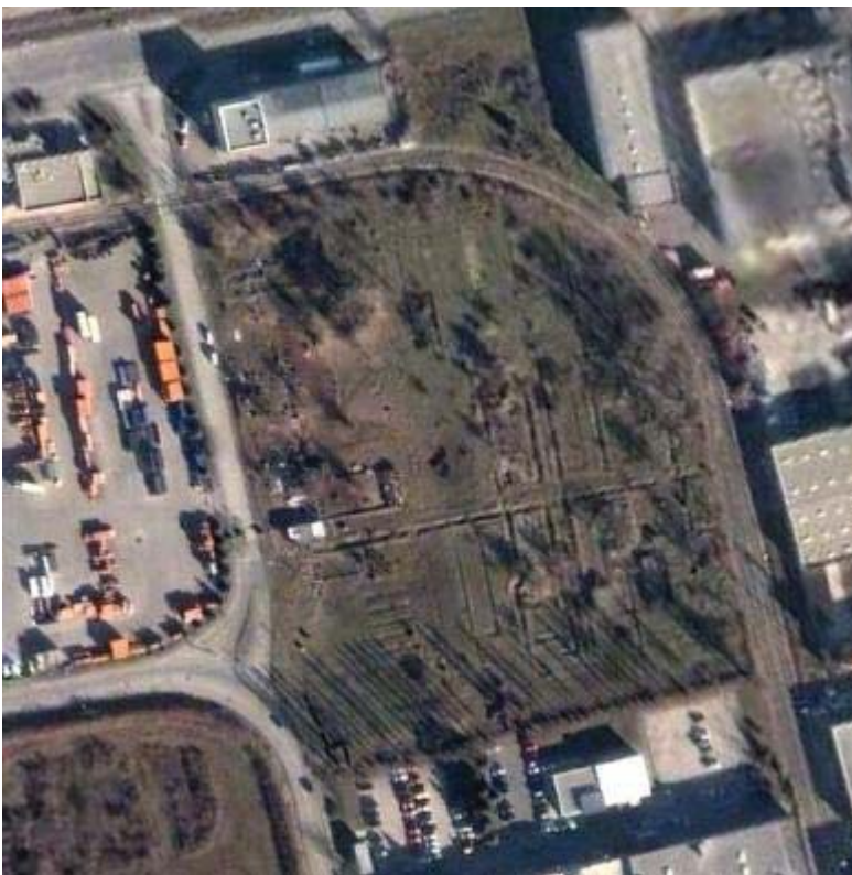
Ein großer Teil des ehemaligen KZ-Geländes ist bis heute unverbaut. Die Grundmauern und die Lagerstraße sind gut erkennbar.

Neben den beiden "kleinen" Konzentrationslagern für ungarische "Ostjuden" im Ort Laxenburg befand sich auch ein Teil des KZ Guntramsdorf auf Laxenburger Ortsgebiet, ebenso wie Teile der FO Werke, in denen die KZ Häftlinge aber auch Zwangsarbeiter schufteten. Beim Todesmarsch nach Mauthausen wurden hunderte Menschen ermordet, die den Lageralltag überlebt haben.